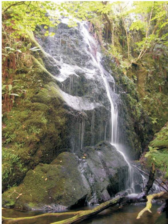
Pena dos Portelos

Esta ferrenza tamén se pode visitar seguindo a ruta Miño-Eo que está indicada desde o Pedregal de Irimia (8 km ata a ferrenza).